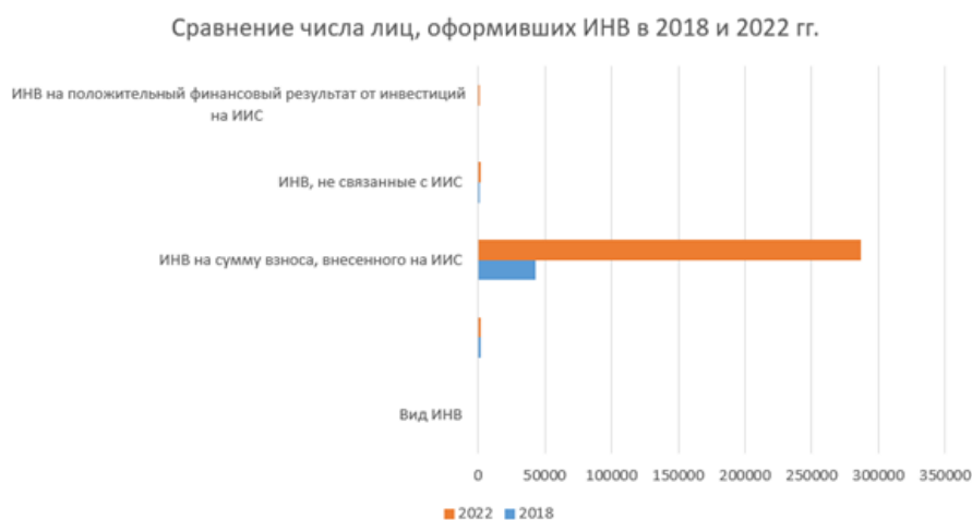
Рис. 1. Сравнение числа лиц, оформивших ИНВ в 2018 и 2022 гг.

1) осуществлял операции с ценными бумагами, обращающимися на организованном рынке ценных бумаг, в результате которых получил доход;